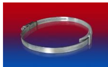
CLAMP 210 BRIDGE CLAMP