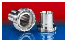
CONNECT DAIRY FITTING 247