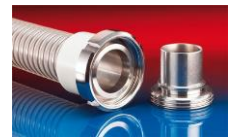
CONNECT MOULD ASSEMBLY 233