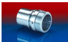
CONNECT THREAD FITTING 234