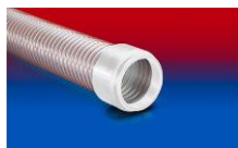
CONNECT 245 FOOD