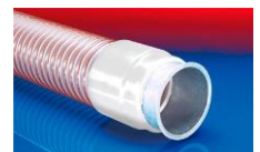
CONNECT 243 FOOD