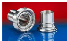
CONNECT ASEPTIC FITTING 249