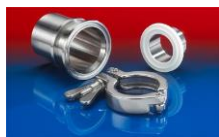
CONNECT TRI-CLAMP FITTING 245