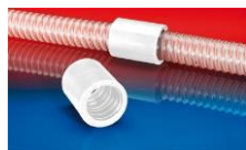
CONNECT 246 FOOD