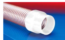
CONNECT 240 + 241 FOOD